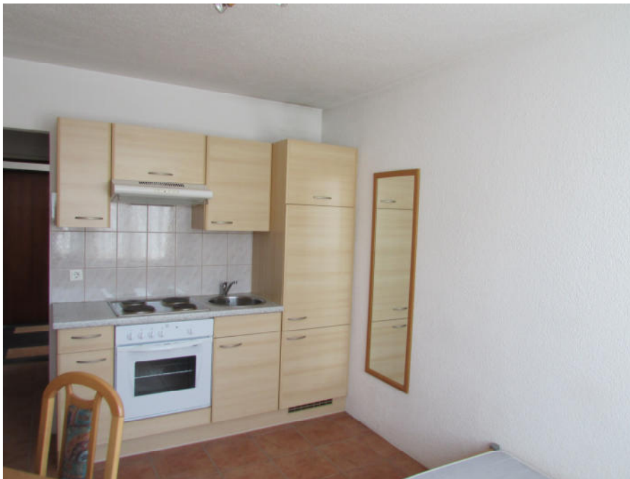
Bild oben: Küchenzeile mit Elektroherd, Backofen und Kühlschrank Bild unten: Badezimmer mit Dusche, WC, Waschbecken und Waschmaschinenanschluss