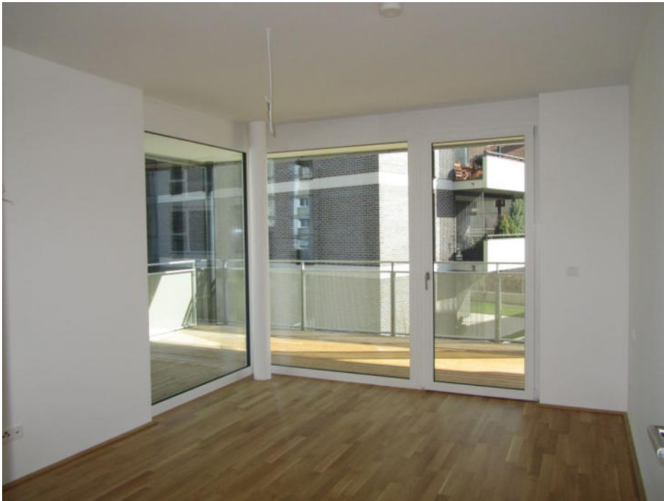
Bild Oben: Zimmer 1 mit Terrassenzugang (ca. 18,41 2 ) Bild Unten: Terrasse