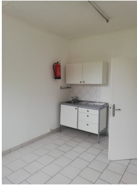
Bild oben: die ca. 14m 2 große Teeküche verfügt über einen Wasseranschluss. Die vorhandenen Möbel können kostenlos übernommen werden.

Bild unten: der Zugang zum ca. 8m 2 großen Archiv/Büro ist momentan offen, die dazugehörige Tür kann jederzeit eingesetzt werden.