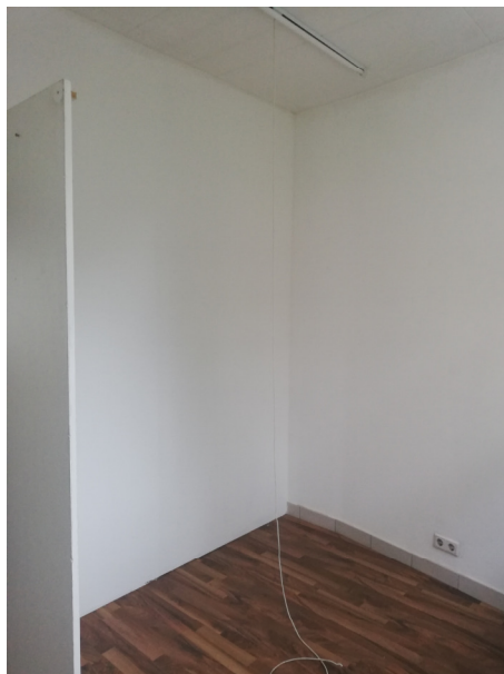
Bild unten: der Zugang zum ca. 8m 2 großen Archiv/Büro ist momentan offen, die dazugehörige Tür kann jederzeit eingesetzt werden.

Bild oben: die ca. 14m 2 große Teeküche verfügt über einen Wasseranschluss. Die vorhandenen Möbel können kostenlos übernommen werden.