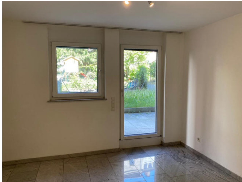
Bild Oben: Zimmer 1 mit Terrassenzugang Bild Unten: Wohnraum mit Terrassenzugang